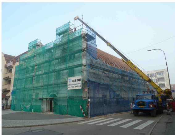
Rekonstrukce Smrčkova domu

Ve 4. čtvrtletí roku prošel SD 1. etapou své rekonstrukce, během které získal především novou střešní krytinu a fasády směrem do náměstí a sousední ulice Protifašistických bojovníků.