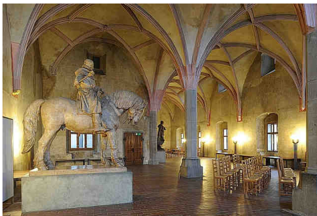
Gotický sál Staré radnice v Táboře

V prvním patře Staré tábořské radnice, která je hlavní expoziční budovou muzea, je návštěvníkům k dispozici unikátní gotický radniční sál (horní mázhaus gotické budovy), jenž je druhým největším profánním gotickým sálem v Č. Konají se zde kromě běžných prohlídek také další programy (kostýmované prohlídky) a akce (koncerty, vernisáže, slavnostní vystoupení apod.). V přilehlých pěti sálech je umístěna muzejní galerie pro