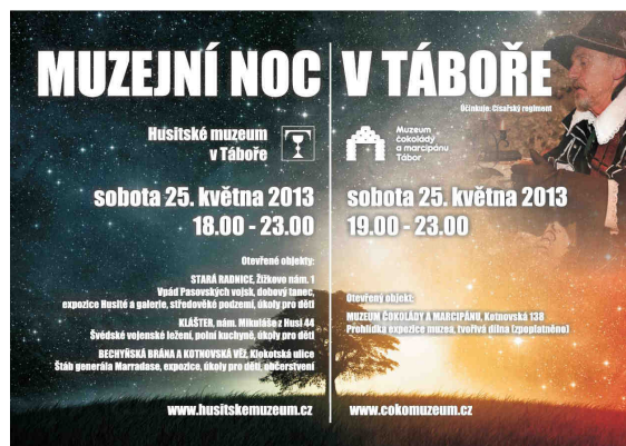
Muzejní noc v Táboře

V sobotu 25. května se v rámci IX. ročníku evropského Festivalu muzejních nocí uskutečnila v pořadí již třetí muzejní noc i v Táboře. Pořádalo ji Husitské muzeum ve spolupráci s Muzeem čokolády a marcipánu. Návštěvníci měli možnost se seznámit s dramatickými okamžiky novověké historie