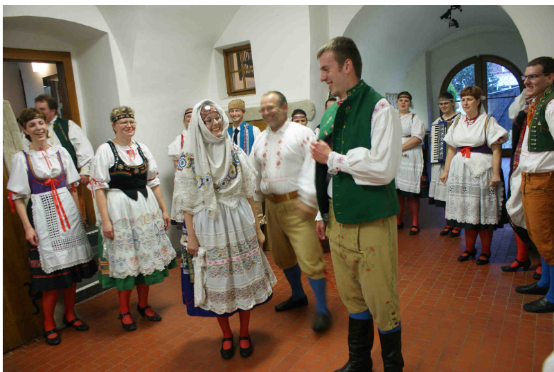
Vystoupení folklórního souboru Soběslavská chasa mladá