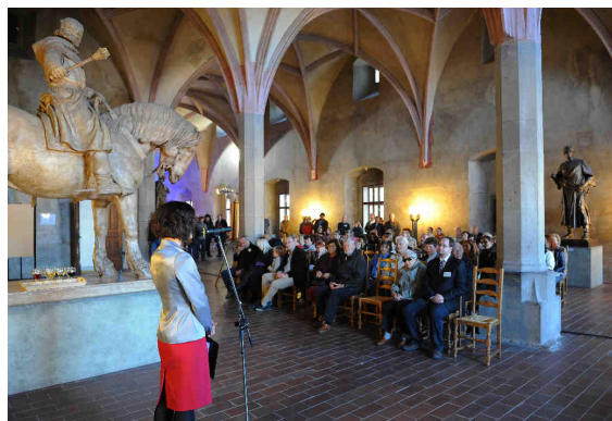
Vernisáž výstavy Obnovená krása

Výstava Obnovená krása ukázala návštěvníkům důležitou funkci muzea jako instituce, která své sbírkové předměty nejen ochraňuje, ale díky zásahům konzervátorů a restaurátorů jim navrácí také jejich lesk a funkci. Celá výstava byla koncipována jako ukázka prací a technik