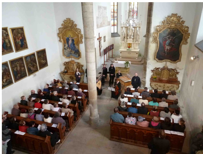
Koncert Loutna česká v Soběslavi

Ve spolupráci BM, města Soběslavi a Římskokatolické farnosti Soběslav proběhl 5. 5. 2013 v soběslavském kostele sv. Víta jedinečný koncert skladeb Adama Michny z Otradovic ze sbírky Loutna česká . Koncert se konal u příležitosti 360. výročí vydání písňové sbírky, jejíž vzácný exemplář byl současně v BM exponátem roku (viz kap. 4.1.1) a tématem přednášky z cyklu Staré i nové zvěsti (viz kap. 4.2.3). Během téměř dvouhodinového programu