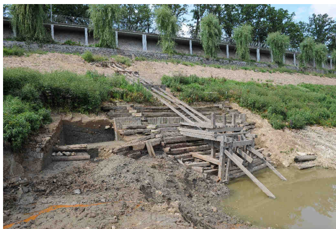
Jordán – jedna z historických výpustí