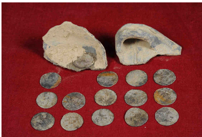
Torzo keramické nádoby a 15 grošů – zbytek depotu ze Rzávé