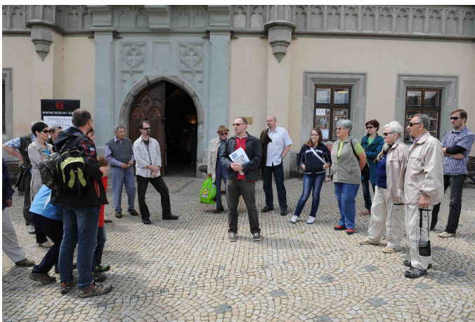
Exkurze „Sobotníci“ před Starou tábořskou radnicí

V Táboře proběhl cyklus vlastivědných exkurzí nazvaný Sobotníci, který každou třetí sobotu v měsíci zavedl účastníky na zajímavá místa spjatá s historií, ale i společenským a kulturním životem města Táboře. Cyklus byl realizován ve spolupráci odborných pracovníků Historického oddělení a muzejního pedagoga.