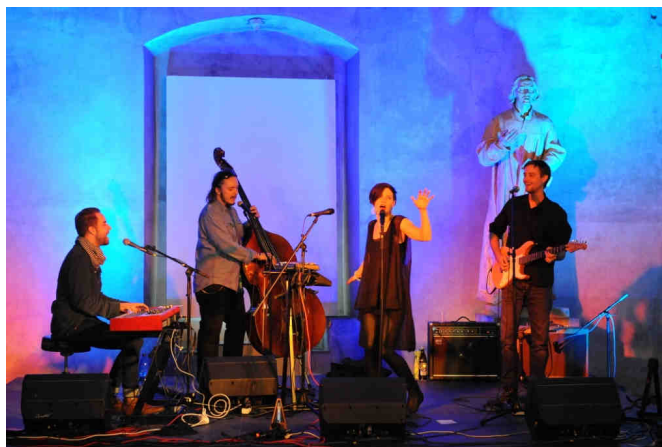
Koncert skupiny LANUGO v gotickém sále