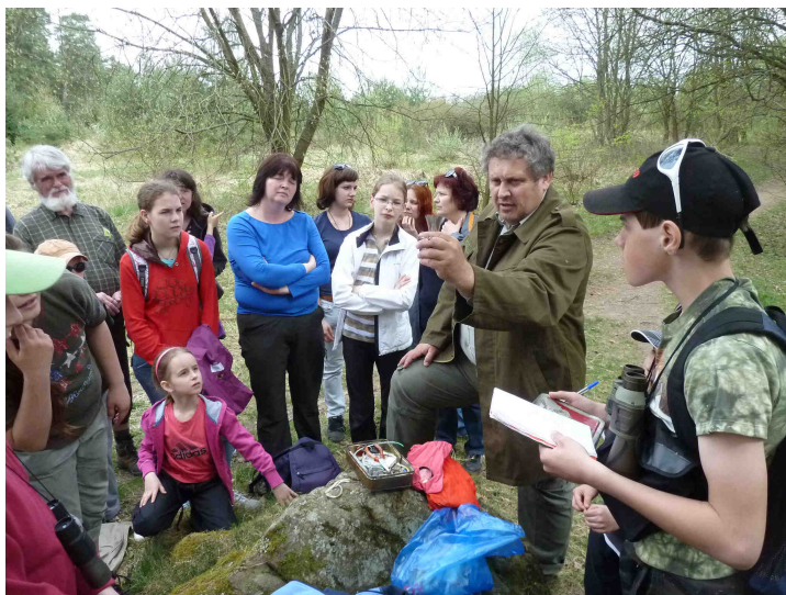
Exkurze Vítání ptačího zpěvu

Již po jedenácté byla připravena nabídka výprav do přírody. Na rozdíl od minulých let, kdy se na koordinaci cyklu podílelo několik subjektů z Táborska a jižní části Středočeského kraje, přebralo letos organizaci BM, dosavadní hlavní pořadatel. S tím souviselo i zaměření 11. ročníku exkurzního cyklu především na přírodu okresu Tábor, ovšem s četnými přesahy do sousedních regionů (poprvé jsme se vydali i do nitra Třeboňské pánve).