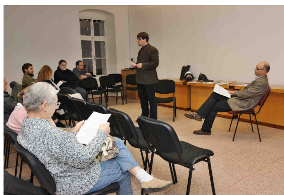
Přednáška Bílá hora