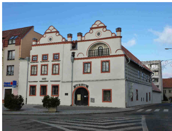
Smrčkův dům po rekonstrukci