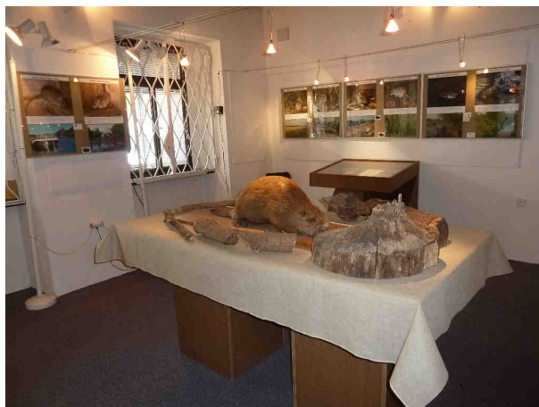
Výstava Neznámý svět drobných savců